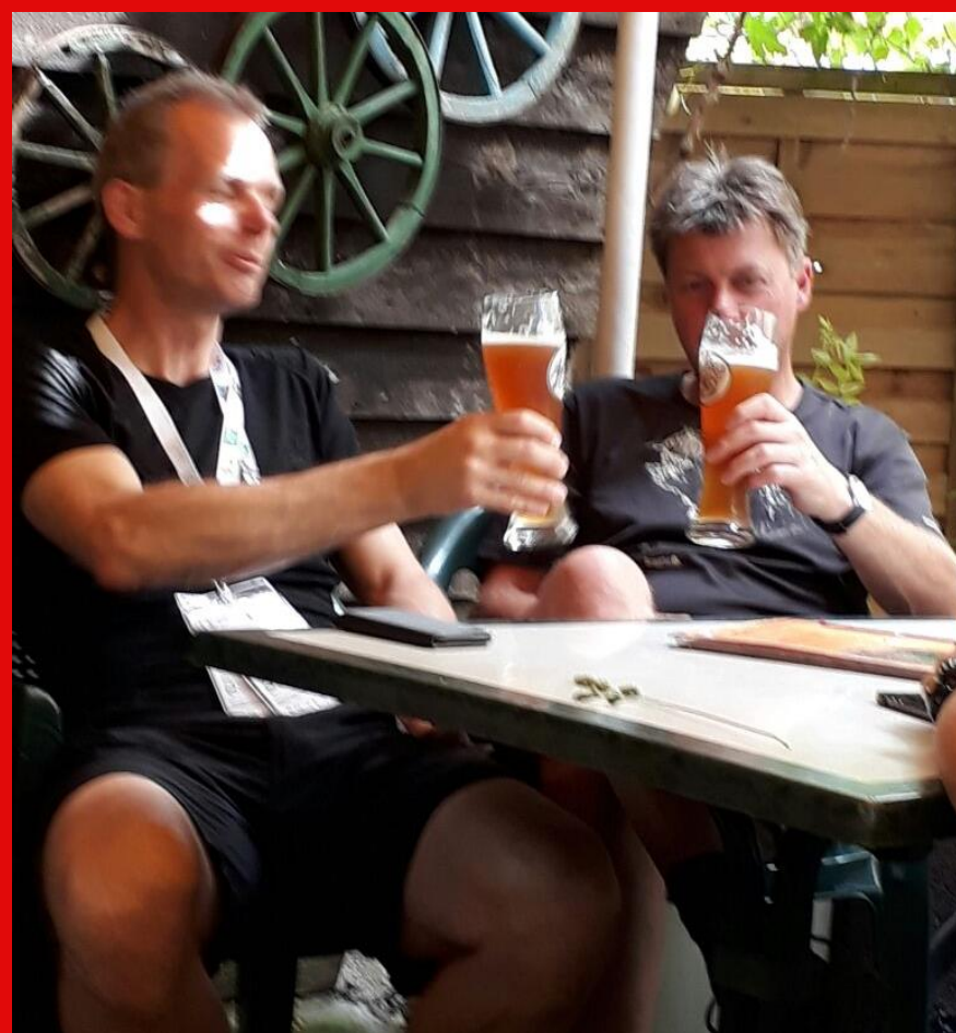
Stärkung nach einer Wanderung