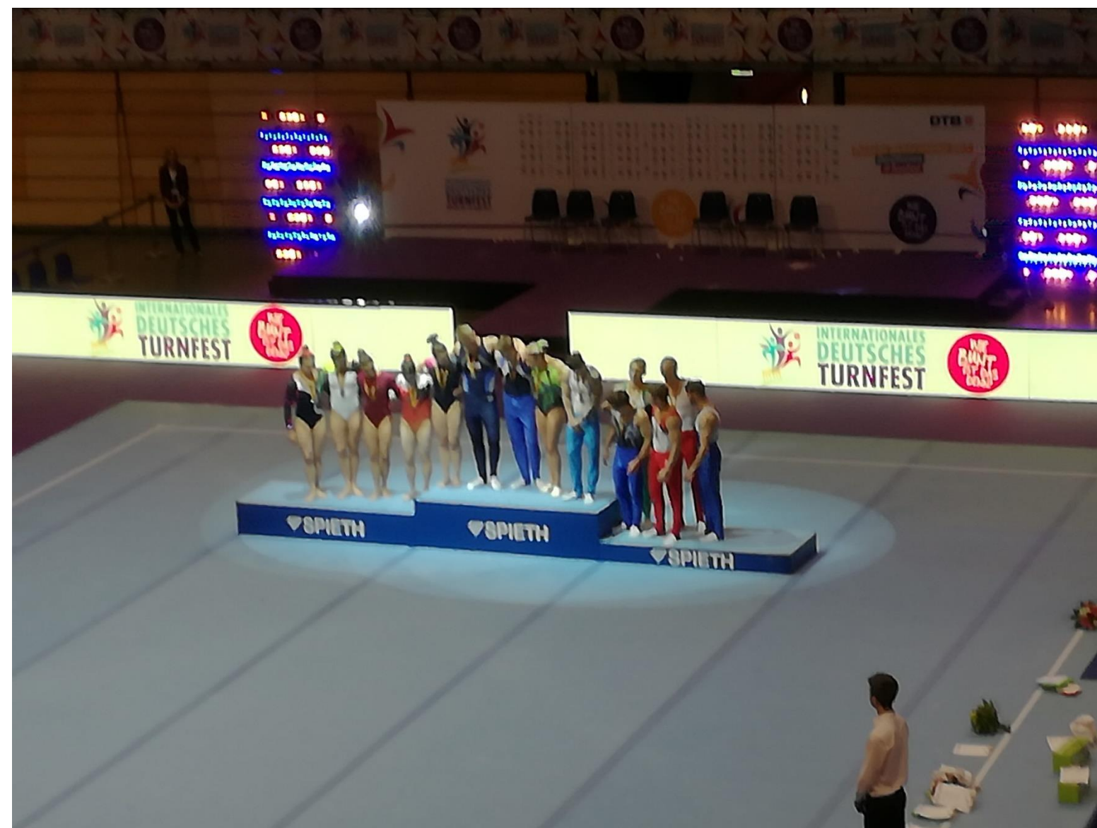
Turn-EM beim Turnfest 2017 in Berlin